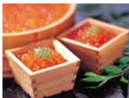
いくら醤油漬(冷凍)